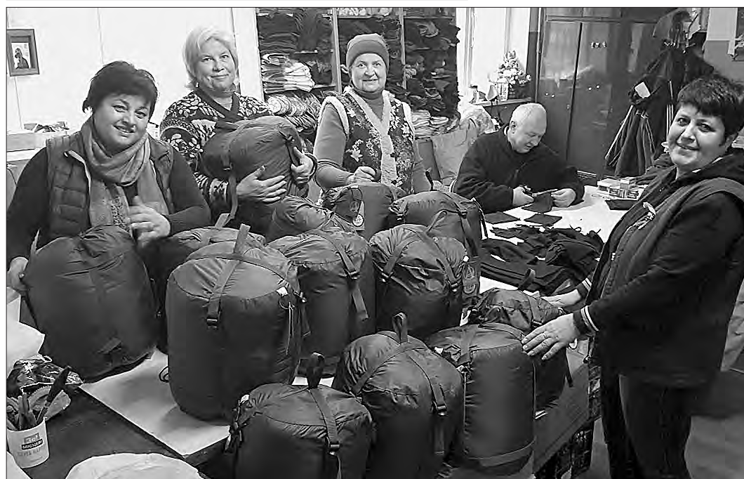
Актив ГО «Разом ми сила» (партнера ВІФ) — потужного волонтерського центру, заснованого в 2014 році в Кропивницькому, який має власне швейне мінівиробництво, фасувальний цех на території хабу.