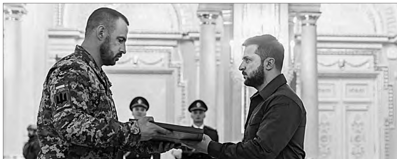
Президент Володимир Зеленський вручає полковнику Денису Дикому орден «Золота Зірка» Героя України.